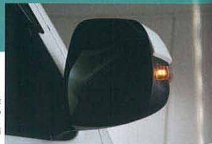
ウインカー点滅時は、レンズ側端の部分まで光り、斜め後方からの視認性も抜群。実用性もしっかりと備えたモデルだ。

に点滅し、先端のアビールの斜め後方からの視認性も考慮されたデザインで、ウインカー機能以外にフォグランプ、オプションランプも備わり、実用性も高い。通常は下部をマッドブラックとしたワートン仕上げで、上部のカラーはハイエース純正色はもちろん、カラーコードさえ分かればその他の色も対応可能。モノトーン仕上げの場合は、マイナス2000円で購入できる。