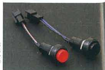
専用スイッチを付属し、流れるウインカーと通常点滅の切り替えやオプションランプのオンオフの操作がワンタッチでできる。