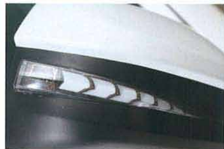
7つのセグメントに分けられた3D立体面発光で抜群の明るさを確保。矢をモチーフとしたデザインは未点灯時もオシャレ。