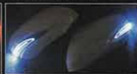
デイランプ点灯時(※オプション)

適合車種 LS460 (USF40系) / LS600 (UVF45系) 適合年式 H18.09~H21.09 (前期モデル)