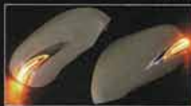
ウィンカー点灯時