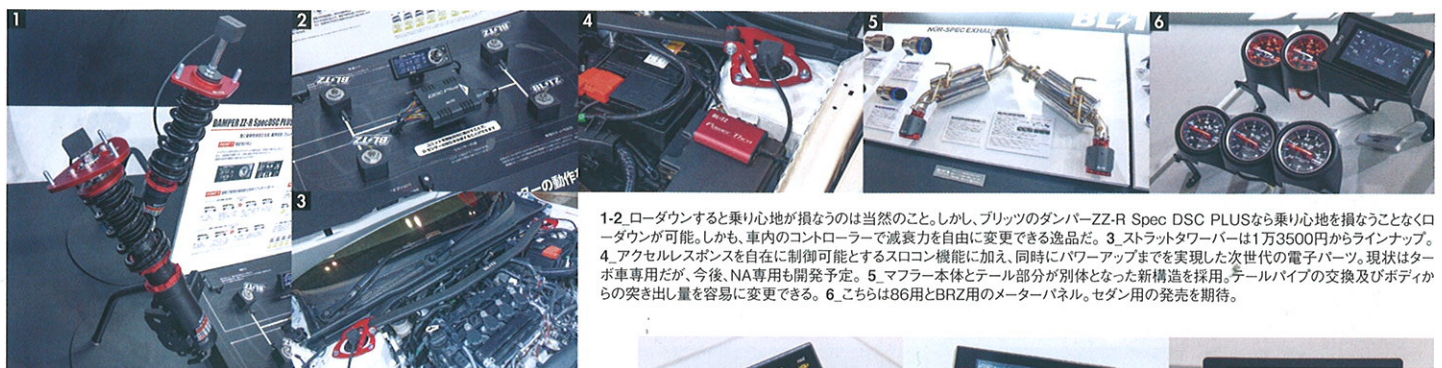
1-2_ロードダウンすると乗り心地が損なうのは当然のこと。しかし、ブリッツのダンパー-ZZ-R Spec DSC PLUSなら乗り心地を損なうことなくロードダウンが可能。しかも、車内のコントローラーで減衰力を自由に変更できる逸品だ。3_ストラットタワーバーは1万3500円からラインナップ。4_アクセルレスポンスを自在に制御可能とするスロコン機能に加え、同時にパワーアップまでを実現した次世代の電子パーツ。現状はターボ車専用だが、今後、NA専用も開発予定。5_マフラー本体とテール部分が別体となった新構造を採用。テールパイプの交換及びボディからの突き出し量を容易に変更できる。6_こちらは86用とBRZ用のメーターパネル。セダン用の発売を期待。