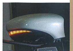
シーケンシャル仕様なので、最旬の装いを手に入りたいオーナーはぜひ。

ヴァーティカルアローシリーズのLEDドラミラーウインカを展示していたアベスト。200クラウンや50カムリ、130マークX用は1万9800円。40LS中期用は2万3320円。