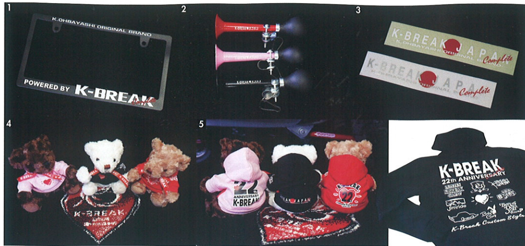
1_意外にも初製作のナンバーフレーム(4620円)。車種問わず使える汎用品。2_盛り上げアイテムのパフパフフラップは2640円。イベントの表彰式の時に使うのが正解。3_新作ステッカーのKブレイクジャパンコンプリートは白とシルバーの2色で、価格は1320円。4-5_Kブレイクの愛しのマスコット・けぶぶ〜への2022仕様がコチラ。パーカーは3種類、3300円。