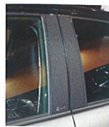
カーボン柄ブラック仕様のピラーパネル。質感が抜群。1万7800円〜。

車種別設計かつ、多彩なカラーバリエーションが自慢のキャリアカバー。ボルトやニップルもあしらひ、パッと見ではカバーだと思わせないクオリティ。価格は2万8600円〜。