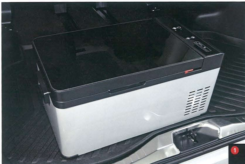
●スタイリッシュなスクエア形状でフタの表面は強化ガラス天板を採用。鏡面仕上げで写り込みが映えるのが特徴だ