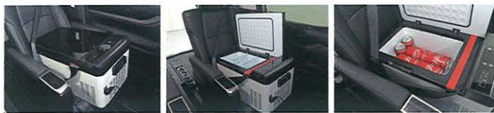
●SZQシリーズは、この18ℓのほかに22ℓと28ℓをラインナップ。いずれもフタを開けてシートベルトを通して固定できる作りなので、シートに置いた状態でも落下しないし、座面上であれば出し入れもしやすい。本体重量は11kgとなっているが、コンプレッサーが備わる操作パネル側が若干重く感じるだけで、大人であれば問題なく持ち運べる