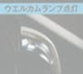
ウエルカムランプ点灯