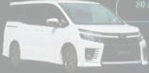
80系ヴォクシー&ノア対応!