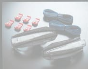
ユニット交換タイプとレンズキット。80系ヴォクシー&ノアのほかに、60系のパリアーにも対応している。鏡面はハイテクイター。