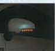
ウインカー時には華麗に流れるように点灯。パツ、パツと点滅する方式にスイッチで切り替えることも可能。