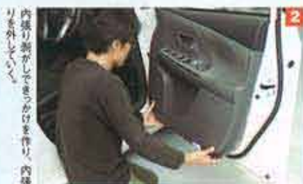
内張り板がしてドアノブのカバーを外し、内張り板を外す。