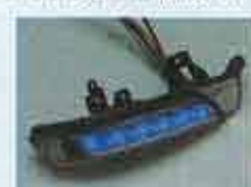
オプションランプとして点灯するLEDは、購入時にホワイト、ブルーの2色から選べる。どちらも美しい光を放つ。

インナーはクロームメッキ、ダークゴールド(仮)の2色をラインアップ。非点灯時でもオアシスに演出できる。