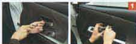
作業前にはまずウインドウを開ける。その後、内張り板がしてドアノブのカバーを外し、その裏にあるネジを外す。