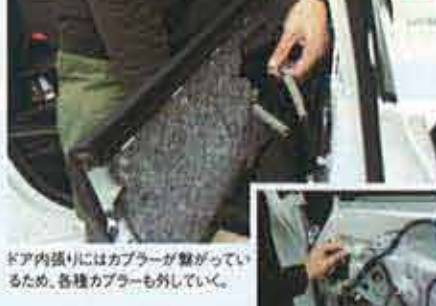
ドア内張りにはカブラーが繋がっているため、各種カブラーも外していく。