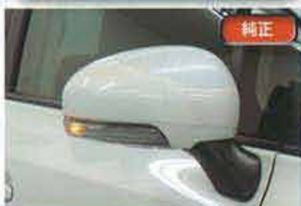
こちらが交換前の純正の状態だ。ウインカーを点灯してみると、ご覧の通りの物足りなさだ。