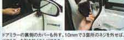
ドアミラーの裏側のカバーも外す。10mmで3箇所のネジを外せば、ドアミラーを引き抜くことができる。