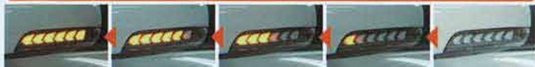
ウインカー作動時には、内側から外側に向かって光が流れるように点灯。面の光と相まって幻想的にライトアップされる。