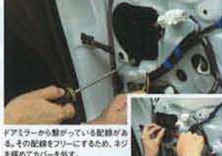
ドアミラーから繋がっている配線がある。その配線をフリーにするため、ネジを緩めてカバーを外す。