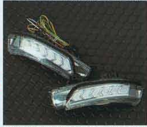
純正レンズとの交換タイプ。ドレスアップ性はもちろん、機能性も格段にアップするアイテムだ。