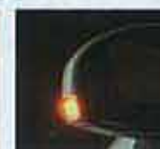
後方向きにもLEDを搭載し、後続車にしっかりとアピールすることができるなど、機能性もアップ。