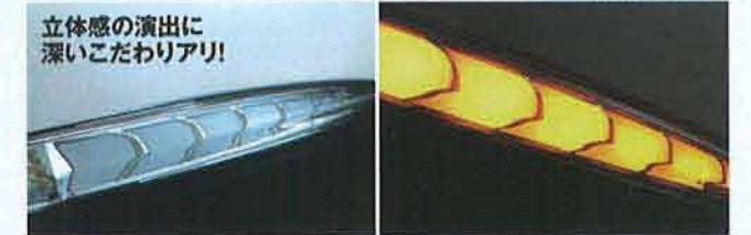
立体感の演出に深いこだわりアリ!

7つのブロックを区分けしている枠部分はメッキ仕立てで、消灯時でも高級感を発揮。使用されるアクリルも平面ではなく、立体的な造形となるようこだわって成形。だから光が流れたときの立体感が強烈で、めっちゃキレイ!