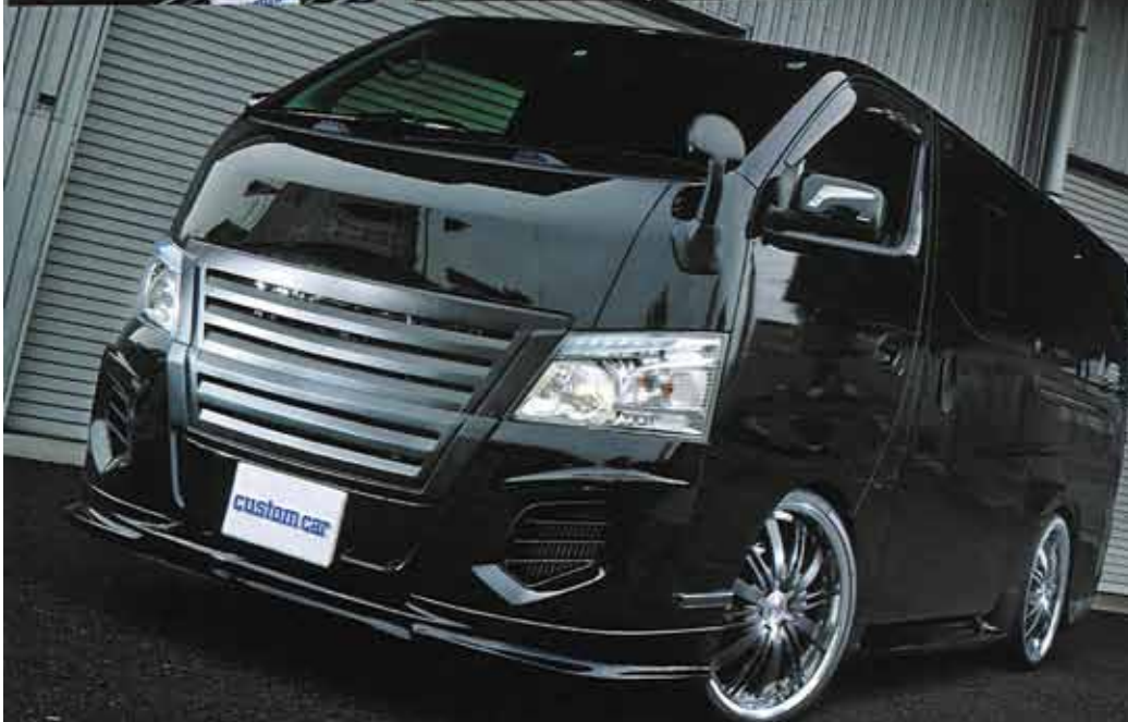
ベースカー>>NV350キャラバン・ バン・プレミアムGX

ピアノブラックウッドハンド ル: 2万7000円、ピアノブラッ クウッドパネル: オープン価格、 WINGS リアベッドキット: 5 万2800円